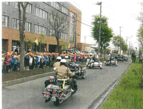
北海道ハーレー警ら隊との共催事業（写真は平成30年）

とんぼ隊の合言葉は「地域が家族のように」。地域が家族のような間柄になれば、一人一人に思いやりの気持ちが生まれ、犯罪や事故が減って地域の皆さんが安全・安心に暮らすことができるというものです。とんぼ隊では、一緒に活動を行う屯田地区の皆さんや、企業からの賛助会費を募集しています。ご賛同いただける方は、屯田まちづくりセンターまでお知らせください。